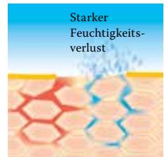
Lipidverlust führt zu einer gestörten Hautbarriere: Die Haut verliert viel Wasser und trocknet aus.