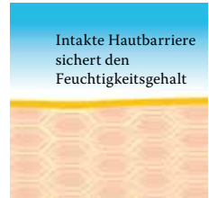
Intakte, schützende Hautbarriere mit Linol-säure-reichen Lipiden.

Besuchen Sie uns unter www.linola.com . Denn dort haben wir für Sie alle aktuellen Informationen über Linola Hautmilch , Linola Gesicht , Linola Hand und Linola Fuß-Milch sowie zu weiteren Linola-Produkten bei verschiedenen Hautproblemen bereitgestellt.