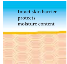
Intact protective skin barrier with lipids rich in linoleic acids.

However, if the structural lipids are removed by too frequent washing, showering or swimming or if they are not produced in sufficient quantities, as is the case in ageing skin or atopic eczema, then the corneocytes become detached from each other and holes develop in the skin's protective barrier.