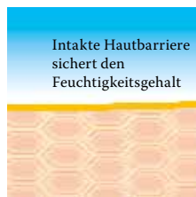
Intakte, schützende Hautbarriere mit Linol-säure-reichen Lipiden

Weitere Informationen stehen für Sie bereit unter www.linola.com